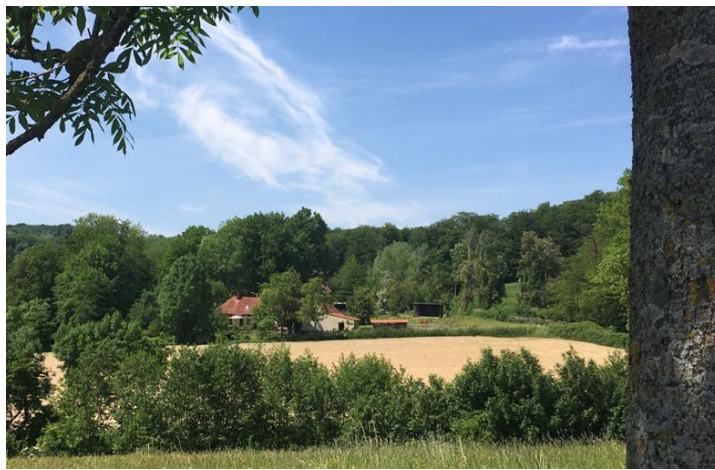
de Rue Neuve ... die naar B&B leidt... prachtig gelegen.

Afgegeven bij WZC St Franciscus Oubraken : wandel wens kaart voor zorgpersoneel + flyers RALiga